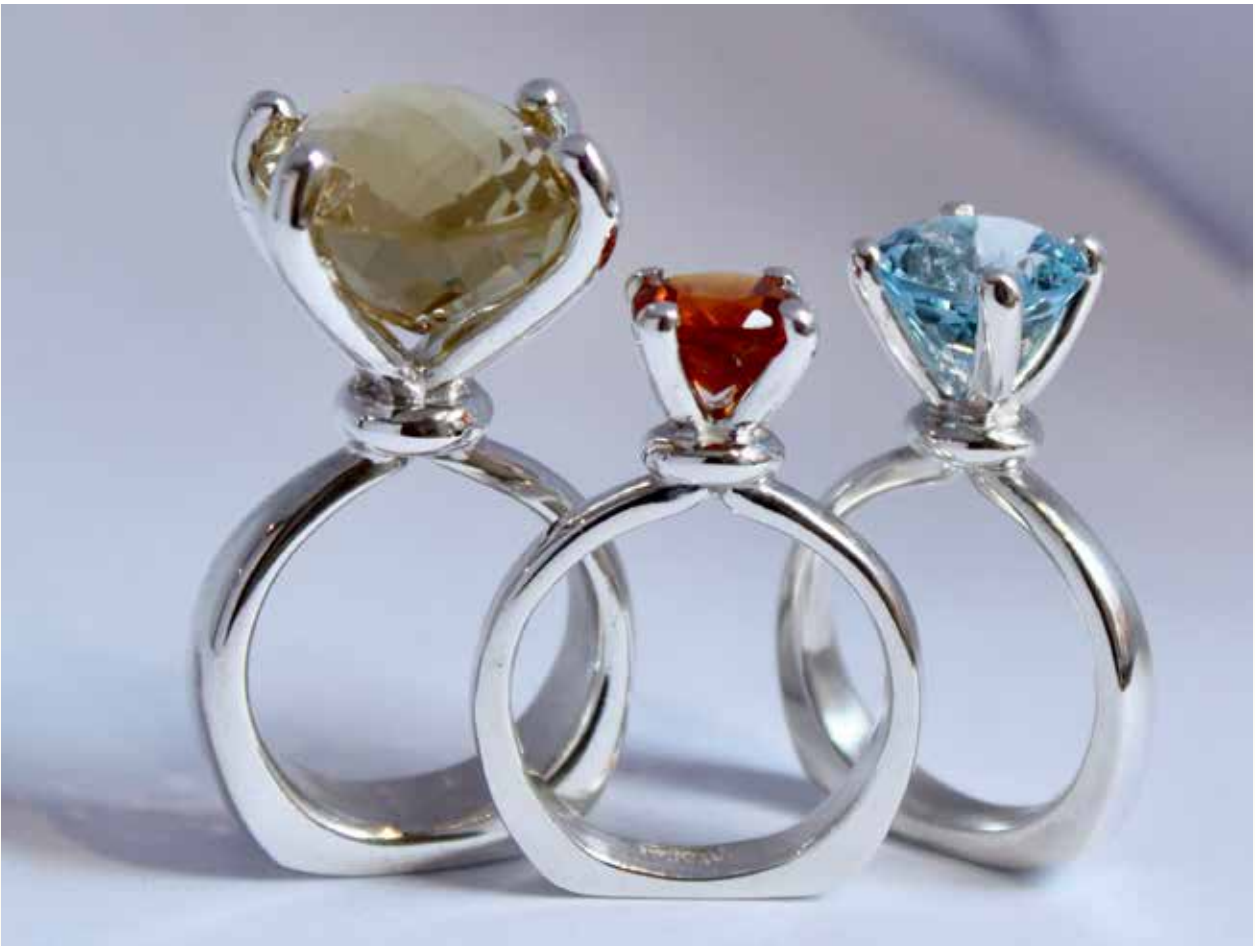
Hantverk verkar få ett uppsving. Ringar från Etena Jewellery & Design.