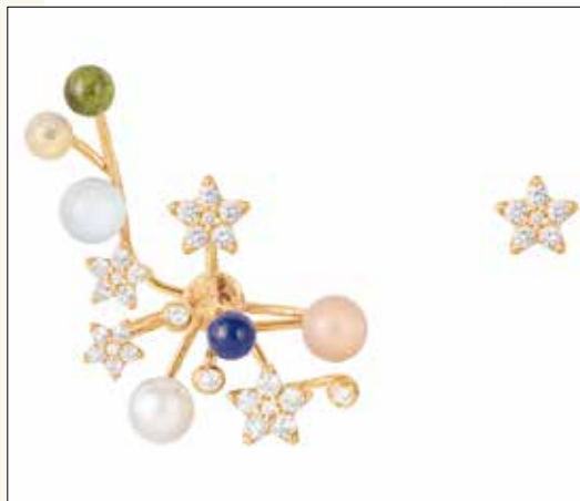
Konsumenter söker sig också till etablerade och kända märken. Här örhängen Shooting Stars från Ole Lynggaard Copenhagen.